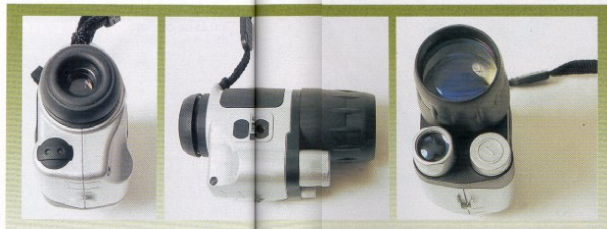
Vistas del NV-N de Yukon desde tres de sus costados, frontal, lateral y posterior.

Pentaflex TELÉFONO: 91 6331354 De venta en establecimientos de Carrefour