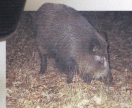
Gracias a sus prestaciones, en caso de oscuridad total o falta de luna se puede recurrir a encender el iluminador de IR incorporado.

Septiembre 2004 del 17 al 19 Carrefour Feria de la Caza, Pesca y Turismo VIERNES de 11'00 a 21'30 h. SÁBADO y DOMINGO de 11'00 a 22'00 h. Tel. de Información 906 274 828